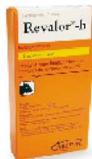
Revalor® H Reg. SAGARPA: Q-0273-175

A partir de este peso reimplante para finalizar las hembras y los machos castrados con Revalor® H .