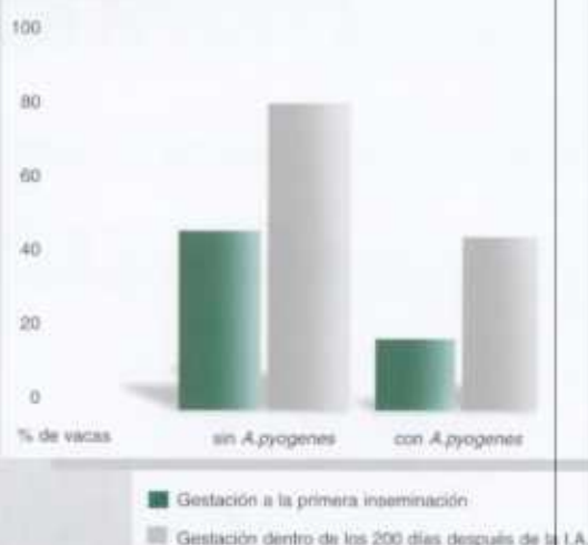
Relación entre la eliminación de A. pyogenes y la fertilidad

La eliminación de A. pyogenes después del tratamiento con METRICURE® resultó en una oportunidad 3 veces más alta de concepción a la primera inseminación y una oportunidad 5 veces más alta de gestación dentro de los 200 días posparto comparado con vacas que permanecieron con la infección de A. pyogenes .